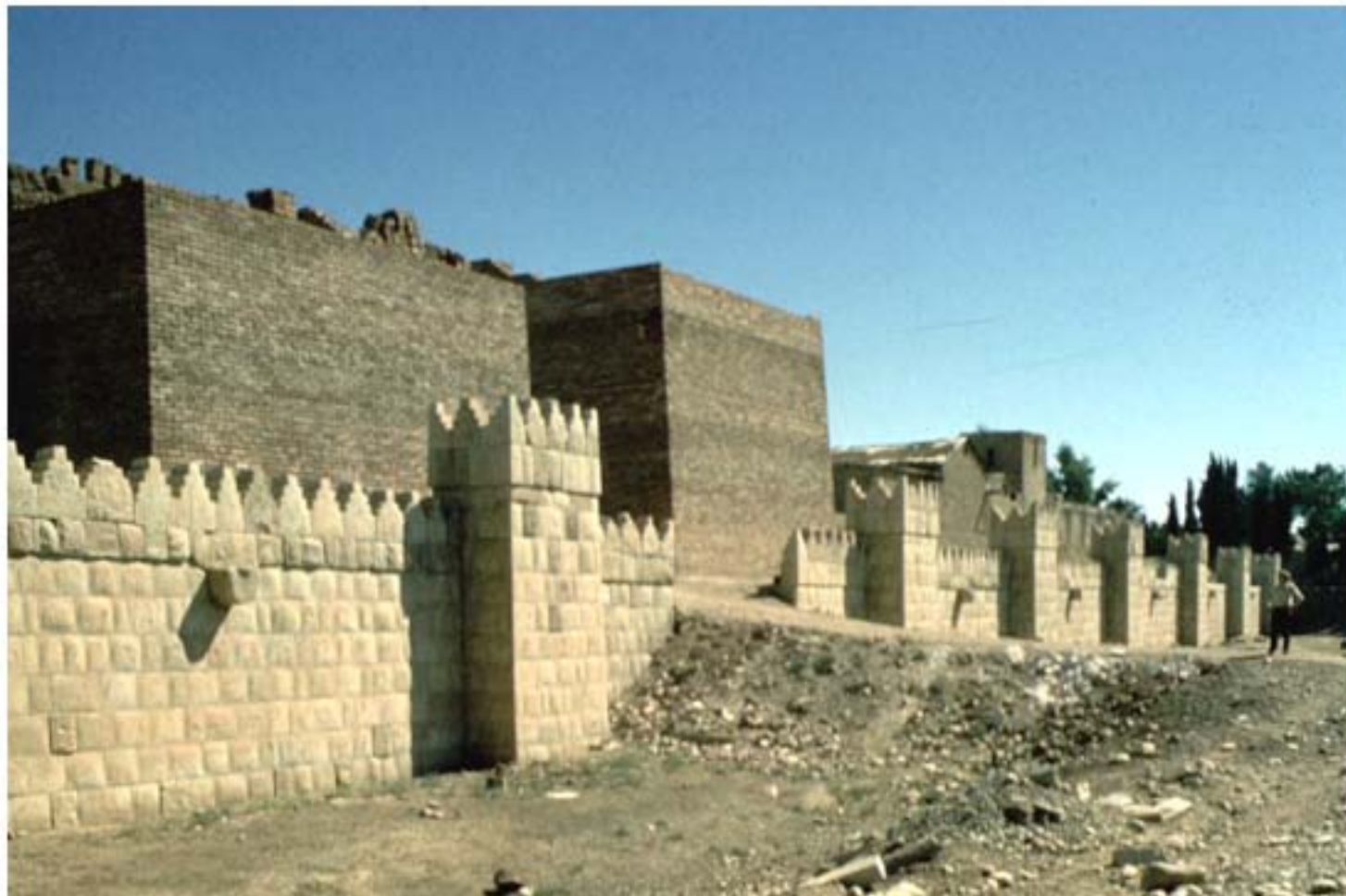
LE MURA ANTICHE (IN GRAN PARTE RICOSTRUIITE)